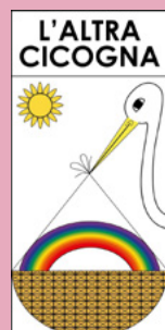
Associazione L'altra Cicogna